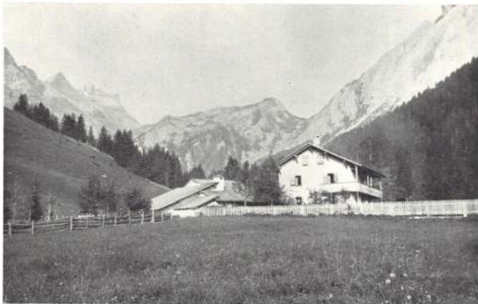
Cergnemin après la première restauration, de 1868 à 1899.

Venez nombreux et nombreuses à cette occasion et n'hésitez pas à partager l'information et à inviter vos proches.